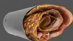
TEXANE Jambon de montagne, bacon, jambon blanc, oeuf, emmental