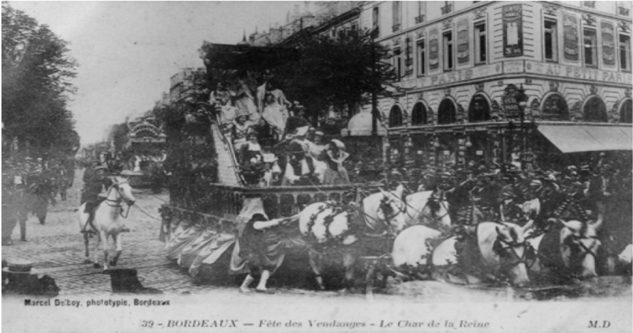
Marcel De'Boy, phototypie, Bordeaux